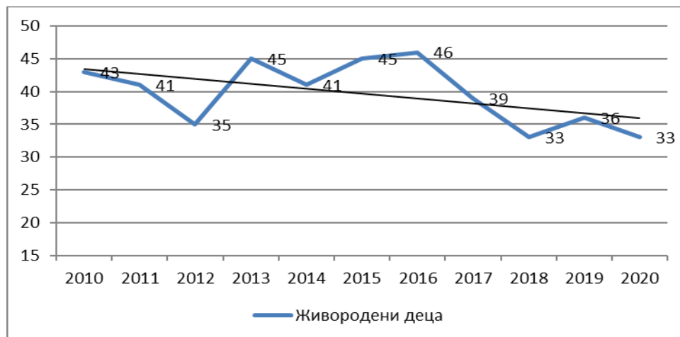
Графикон 3. Живородени деца од 2010 до 2020 година.

Исто така, во периодот од 2010 година до 2020 година се намалува бројот на живородени деца во општината. Во 2010 година имало 43, во 2016 година се достигнало највисокото ниво од 46 деца, додека во 2020 година 33 што преставува намалување за 23% во однос на 2010 година.